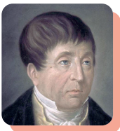
Rouget de L'Isle