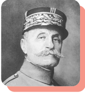
Ferdinand Foch :