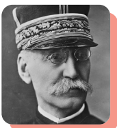
Joseph Gallieni :