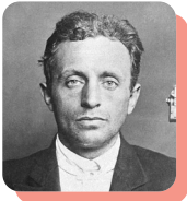
Raoul Villain :