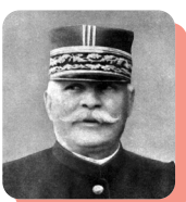
Joseph Joffre :