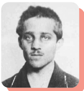
Gavrilo Princip :

En vous aidant du manuel et d'une recherche personnelle, rédigez une courte biographie pour ces personnages :