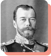
Nicolas II Romanov :