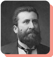
Jean Jaurès :